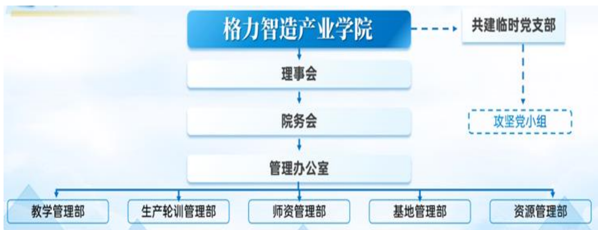
产业学院组织架构示意图

产业学院下设理事会、院务会和管理办公室。共建产业学院临时党支部，校企党员搭档攻坚，共同认领建设任务，共同解决问题，推进落实。在管理办公室之下，设置了教学管理部、生产轮训部、师资管理部等重要的管理机构，推进落实各项任务。