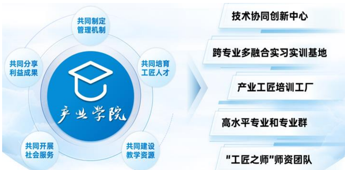
成都格力产业学院建设规划