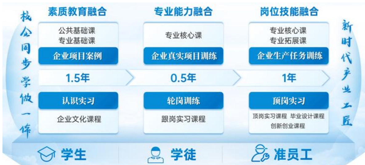
产业学院高技能人才培养模式

企业与学校共同制定了“学做一体”的工匠人才培养方案。通过认识实习、轮岗训练、顶岗实习三种不同的教学模式，将企业真实项目案例融入学生到准员工的全程，分阶段逐步实现素质教育的融合、专业能力的融合、岗位技能的融合。真正培养出企业需要的高素质新时代产业工匠。通过这样模式培养出来的准员工，不仅能够符合格力的人才岗位需求，也能够适应产业转型升级后智能制造产业全链条的需要，真正能够支撑产业、国家的建设和发展。