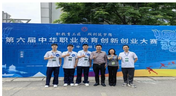
中华职教社大赛获奖

在企业的支持下，产业学院孵化的双创项目参加中华职教社学生双创大赛获得国家级一等奖，参加中国国际大学生创新创业大赛（原互联网+大赛）获国家级二等奖。